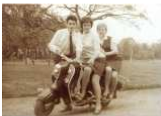
De Voort Op

In Genk wordt hard gewerkt aan de overzichtstentoonstelling 'Genk door schildersogen': een verrassende kijk op pre-industrieel Genk, dat 'geschapen werd om geschilderd te worden...'. In Houthalen-Helchteren werden verschillende actoren samen aan een groot Dialectwoordenboek, mét geluidsfragmenten en een aantal randactiviteiten. Hun jaarlijkse Wijk in de kijker-project 'Centrum' is ondertussen al afgerond. Net zoals het project 'Mijn-wortels Eten', waarbij kinderen van de wijk De Standaard op een creatieve manier aan de slag gingen met het mijnverleden. Het project M-beeld wil dan weer onderzoeken hoe erfgoed en identiteit hun invloed uitoefenen op de (studie)keuzes van jongeren.